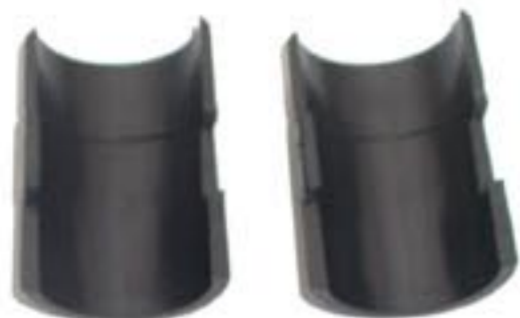
plastové objímky (pár)

Plastové objímky (a tím i police) lze uchytit na stojině regálu v rastru 25 mm